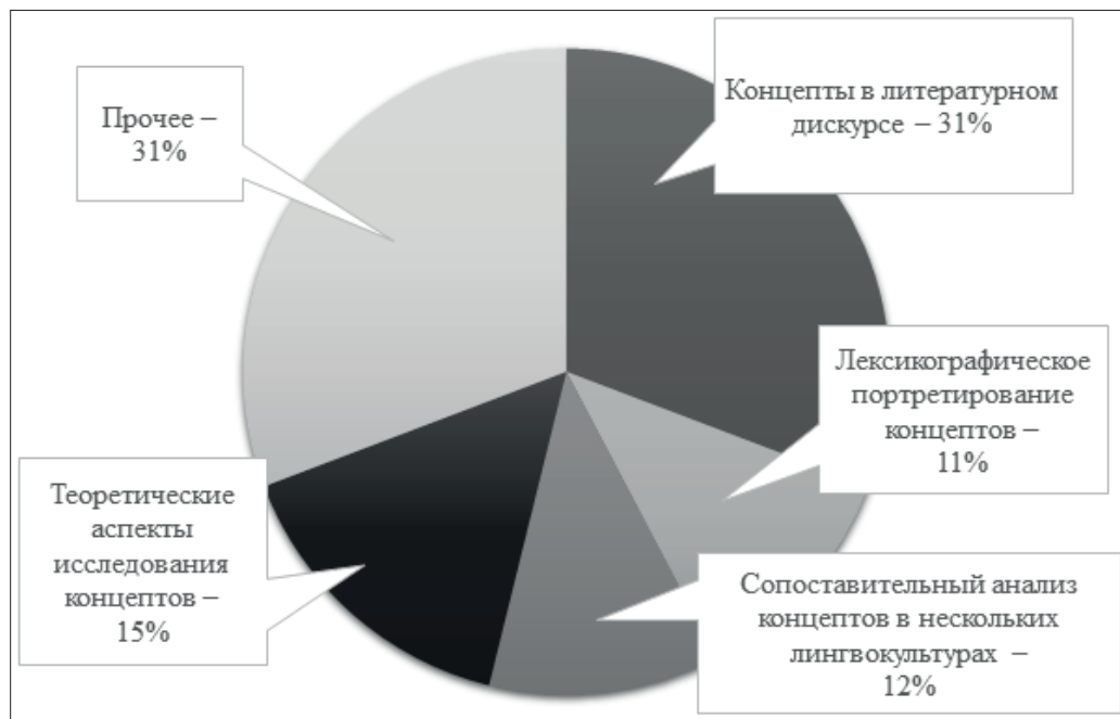
Рис 3. Диаграмма «Тематика статей “Вестника МГПУ. Серия “Филология. Теория языка. Языковое образование”»»