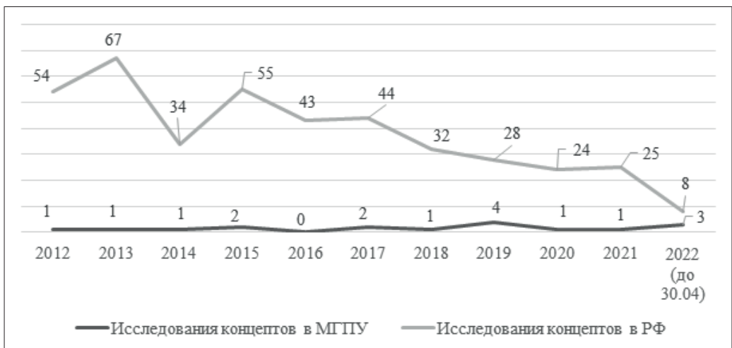
Рис. 2. Диаграмма «Распределение количества защит по годам»

Обратимся к сравнению распределения количества диссертационных работ в России и в МГПУ по годам написания (рис. 2). Из приведенного графика видно, что количество диссертационных трудов, создаваемых в МГПУ, весьма стабильно на протяжении всего последнего десятилетия. Общее же число исследований концептов в стране довольно изменчиво. Так, в 2014 году защищено почти в два раза меньше работ, чем в 2013 году. Возможно, данная статистика объясняется рядом факторов, в том числе экстралингвистических, например особенностью функционирования диссертационных советов. Кроме того, в целом по стране наблюдается общий спад интереса к описанию концептов.